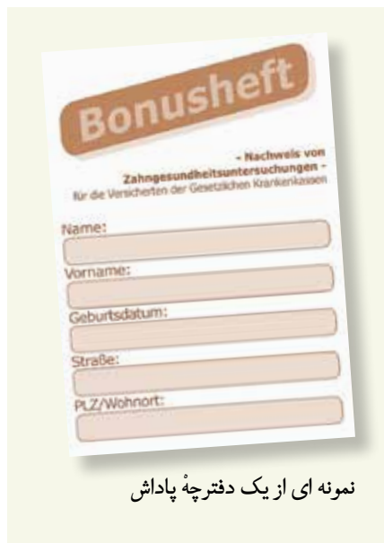
نمونه ای از یک دفترچه پاداش

جایگزین دندان شامل روکش ها، پل ها و پروتزها می باشد. بیمه های درمانی مطابق با تشخیص پزشک نوعی "یارانه ثابت" (Festzuschuss) پرداخت می کنند. به این معنی که صندوق بیمه ۵۰ درصد از مخارج مراقبت های پزشکی واجب را می پردازد. اگر در ۵ سال گذشته، هر سال به معاینات پیشگیرانه رفته باشید (دفترچه پاداش) این یارانه به ۶۰ درصد و بعد از ده سال به ۶۵ درصد افزایش می یابد.